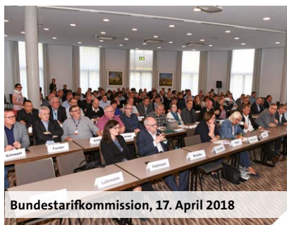
Bundestarifkommission, 17. April 2018