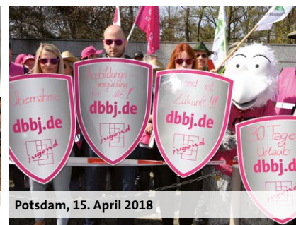
Potsdam, 15. April 2018