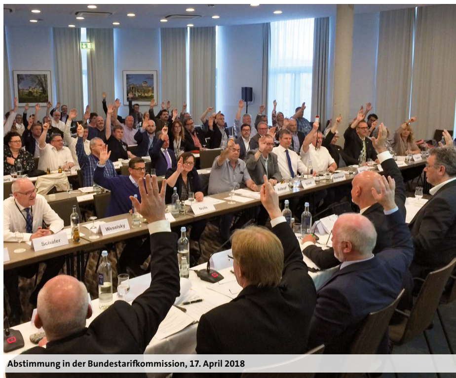
Abstimmung in der Bundestarifkommission, 17. April 2018

Pflege und TVPöD ab dem Urlaubsjahr 2018 bei einer 5-Tage-Woche von 29 auf 30 Arbeitstage erhöht. Die bisherige Übernahmeregung wird über die Mindestlaufzeit der Entgeltregelungen hinaus bis einschließlich Oktober 2020 vereinbart.