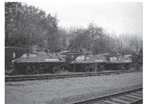
Festung Bahnhof Hitzacker: Die Kolleginnen und Kollegen des BGS hatten den Bahnhof fest im Griff

Von dieser Stelle dafür einen herzlichen Dank an alle Eingesetzten Kolleginnen und Kollegen aus dem ganzen Bundesgebiet!