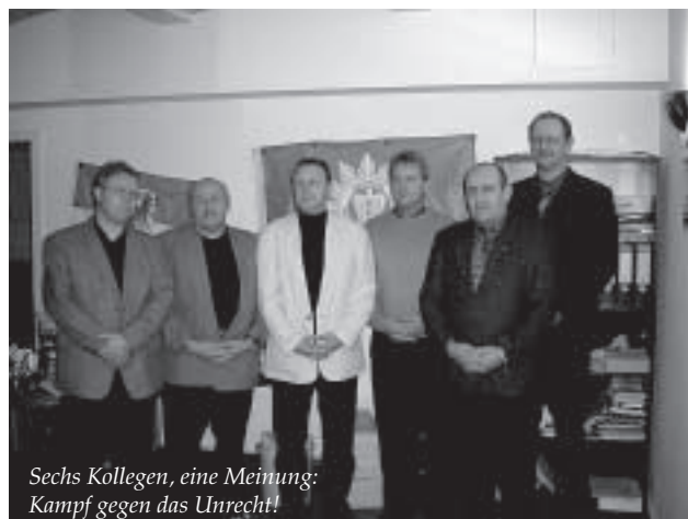
Sechs Kollegen, eine Meinung: Kampf gegen das Unrecht!

nen besonders der Regierungschefs der Länder den Anfang vom Ende der Fürsorgepflicht der Dienstherren und der Treuepflicht der Beamten: