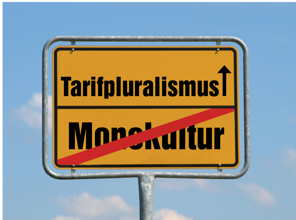
Von der Monokultur zum Tarifpluralismus

Die dbb tarifunion ist das tarifpolitische Dach von 38 Fachgewerkschaften. Die Interessen ihrer Mitglieder sind vielfältig. Pluralität, Kontroverse und Kompromiss sind Trumpf, wenn intern um die Positionierung gerungen wird. Nach außen hin ist das nicht anders! Gegenüber Arbeitgebern, aber auch in der Auseinandersetzung mit anderen Gewerkschaften steht vor dem Tarifiergebnis die Tarifauseinandersetzung. Festzustellen ist, dass die Interessenvielfalt der Beschäftigten in den letzten Jahren zugenommen hat. Bei der Vielfalt an Aufgaben und Berufsbildern im Öffentlichen Dienst ist dies auch kein Wunder! Festzustellen ist aber auch, dass die Tarifpartner in der Bundesrepublik ihre Aufgabe in den letzten 60 Jahren gut gelöst haben. Frei von gesetzgeberischen Bevormundungen. Das Zauberwort für diesen Erfolg war und ist Tarifautonomie!